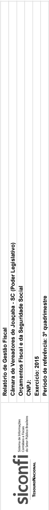
RGF-Anexo 01 | Tabela 1.2 - Trajetória de Retorno ao Limite da Despesa Total com Pessoal | Padrão