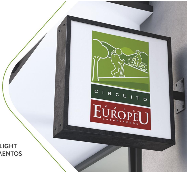
PLACA BACKLIGHT ESTABELECIMENTOS

(47) 3380-1345 contato@cimvi.sc.gov.br cimvi.sc.gov.br Rua Tupiniquim, nº 1070 - Zona Rural Timbó-SC CEP 89.120-000 CNPJ: 03.111.139/0001-09