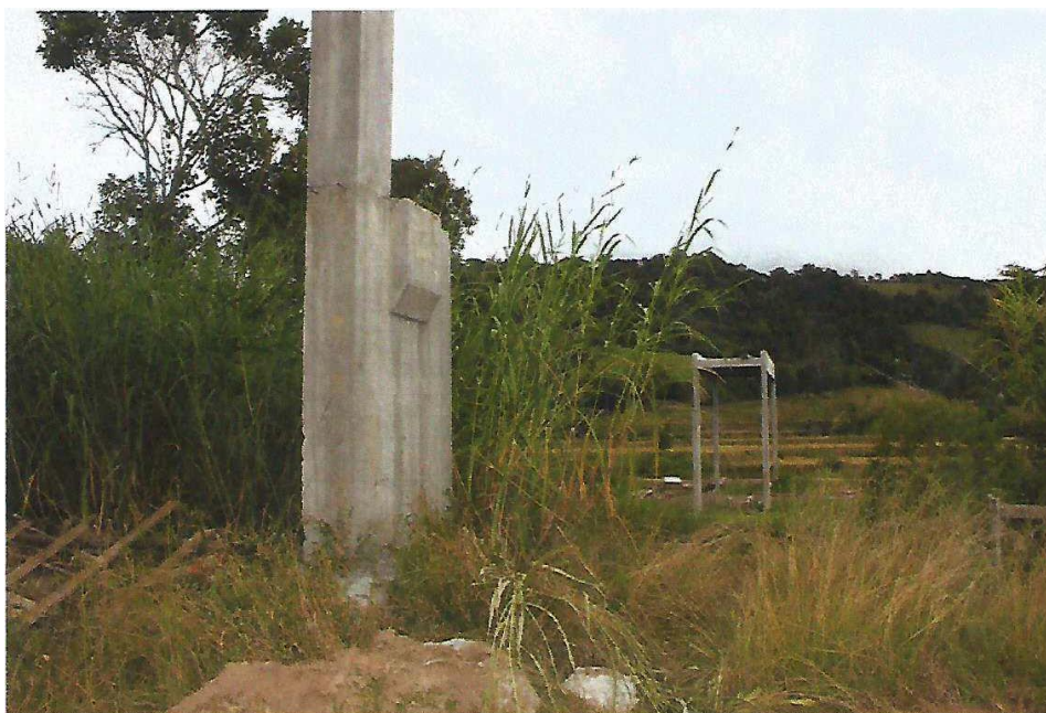
Figura 5 - Ponte Passo da Limeira: Etapa conforme Relatório de Progresso Meta 1, Letra A, B, C, D e E.