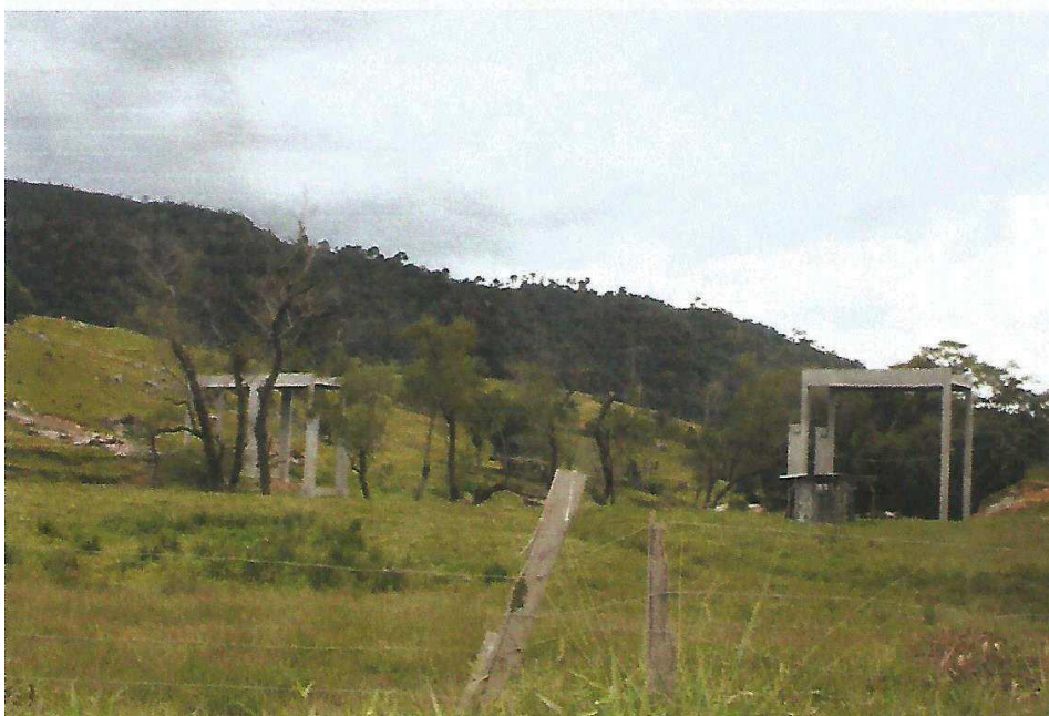
Figura 4 - Ponte São Wendelino: Etapa conforme Relatório de Progresso Meta 2, Letra A, B, C, D e E.

Rua José de Anchieta, nº 119 – Centro – Alfredo Wagner – SC camara.aw@gmail.com- Fone: (48) 3276-1077