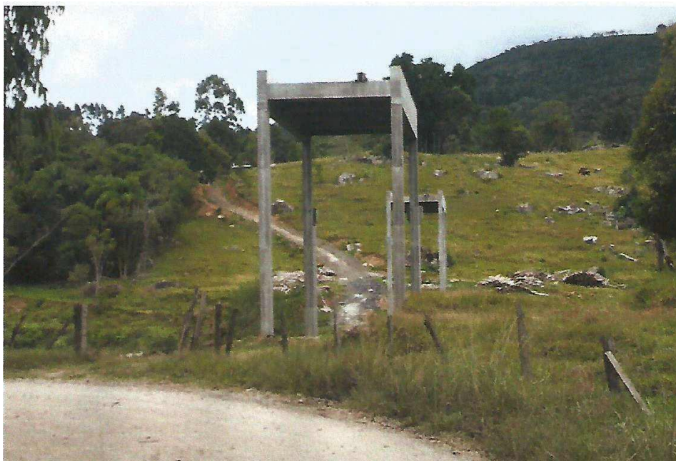
Figura 3 - Ponte São Wendelino: Etapa conforme Relatório de Progresso Meta 2, Letra A, B, C, D e E.