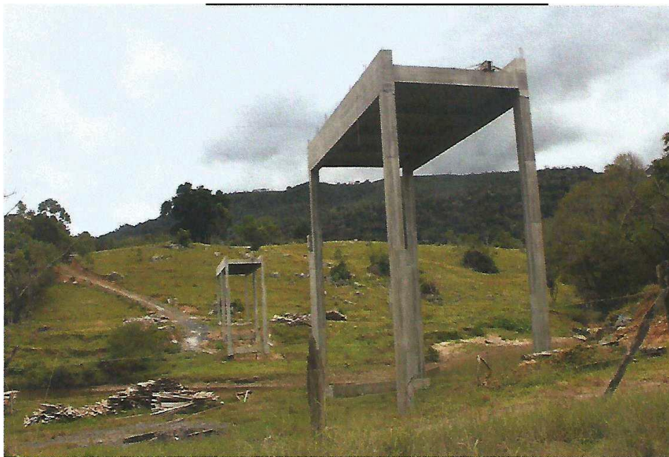
Figura 1- Ponte São Wendelino: Etapa conforme Relatório de Progresso Meta 2, Letra A, B, C, D e E.