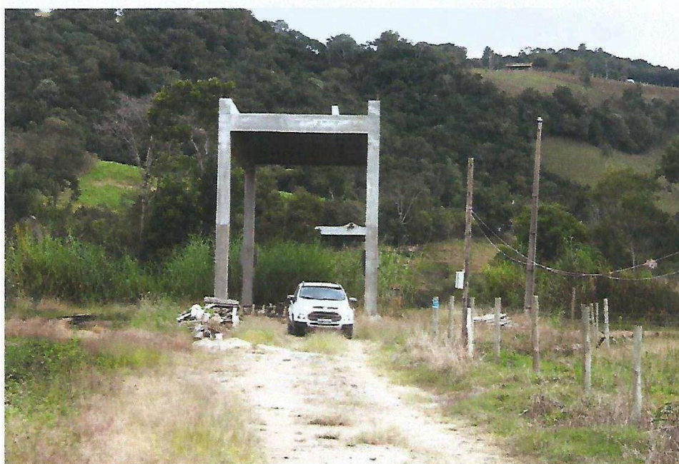
Figura 8 - Ponte Passo da Limeira: Etapa conforme Relatório de Progresso Meta 1, Letra A, B, C, D e E.

Rua José de Anchieta, nº 119 – Centro – Alfredo Wagner – SC camara.aw@gmail.com- Fone: (48) 3276-1077