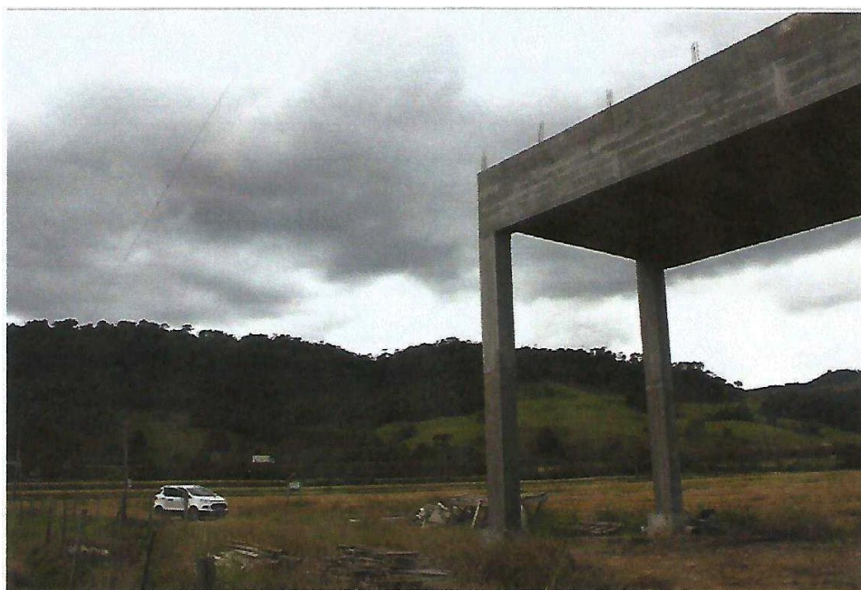
Figura 7 - Ponte Passo da Limeira: Etapa conforme Relatório de Progresso Meta 1, Letra A, B, C, D e E.