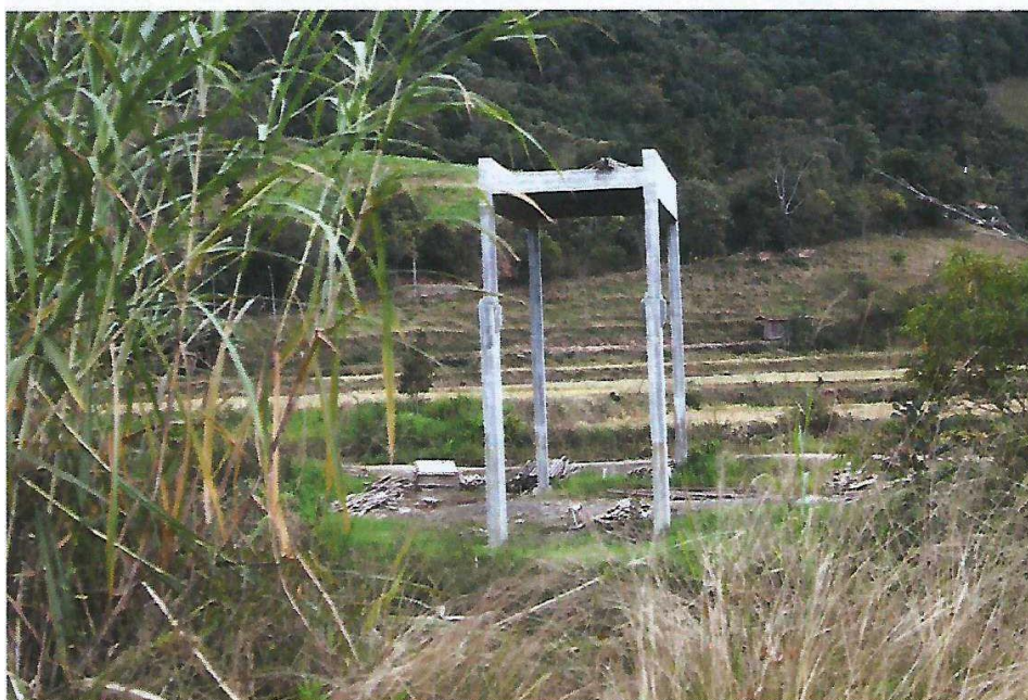
Figura 6 - Ponte Passo da Limeira: Etapa conforme Relatório de Progresso Meta 1, Letra A, B, C, D e E.

Rua José de Anchieta, nº 119 – Centro – Alfredo Wagner – SC camara.aw@gmail.com- Fone: (48) 3276-1077